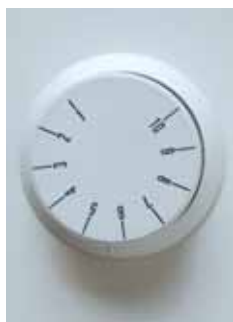
▶ ELEKTRONISKT TERMOSTAT